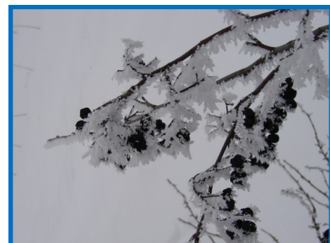
«Зимний наряд для рябинки».