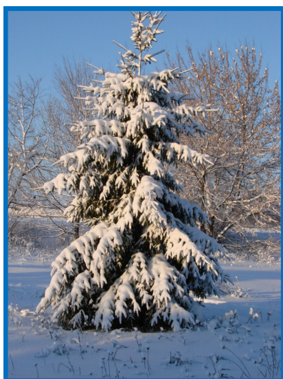
«Шубка для ёлочки».